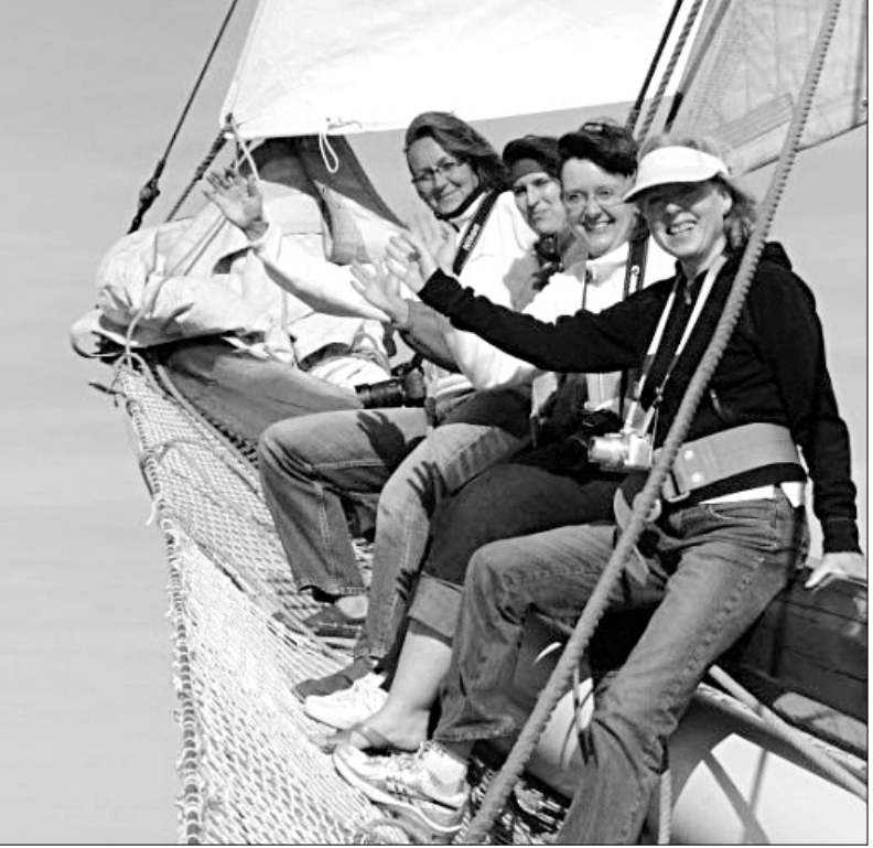
Sie haben Spaß auf dem Foto-Segler: Eine Frauschaft am Klüversegel.

Freyung-Grafenau. Die vhs des Landkreises weist auf ein besonderes Angebot in ihrem Programm hin: Auf einem 26-Mann/Frau-Segelschiff finden im Juli und August 2010 interessante Fotofreizeiten statt. Die Kurse dauern jeweils eine Woche. Es werden weder Kenntnisse im Fotografieren noch im Segeln vorausgesetzt. Mit einem geräumigen Schoner segeln die Teilnehmer zu den englischen Kanalinseln Sark, Guernsey, Jersey, Alderney und Herm und an der Küste der Bretagne entlang. Eine Fülle der herrlichsten Fotomotive auf dem traditionellen Segelschiff, in den malerischen Häfen und in der abwechslungsreichen Inselwelt werden aufgegriffen und fotografisch umgesetzt. Dabei gibt es reichlich Tipps für digitale Anfänger und Fortgeschrittene von der Aufnahmetechnik bis zur Bildbearbeitung. Hochwertige Digitalkameras können ausgeliehen werden. Und wer sich von der klassischen Silberfotografie nicht trennen will, ist auch willkommen. Im Schiffslabor werden Diafilme sofort entwickelt, gerahmt und abends auf Segeltuch projiziert